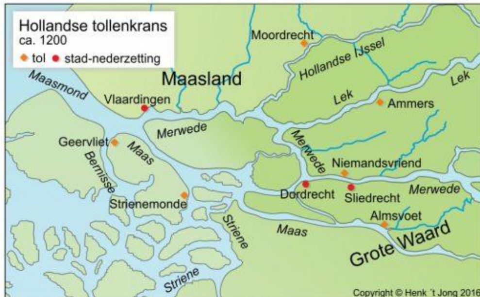
Afbeelding 2: de Hollandse tollenkranen

De graven van Holland zagen dit natuurlijk ook gebeuren en herschikte hun tollennetwerk met Dordrecht in het midden als spin in het web. De tollens waren vrij fors, vaak een tiende van de waarde van je lading. Later rond 1158 werd dat teruggeschroefd naar een vijfde op last van de keizer. Floris III van Holland leek toch extra belasting te innen waardoor een Vlaams leger Holland plunderde in datzelfde jaar. Later in 1167 Floris III zelfs gevangen namen. Hij moest toen wel de Vlamingen hun zin geven en erkende het Verdrag van Brugge.