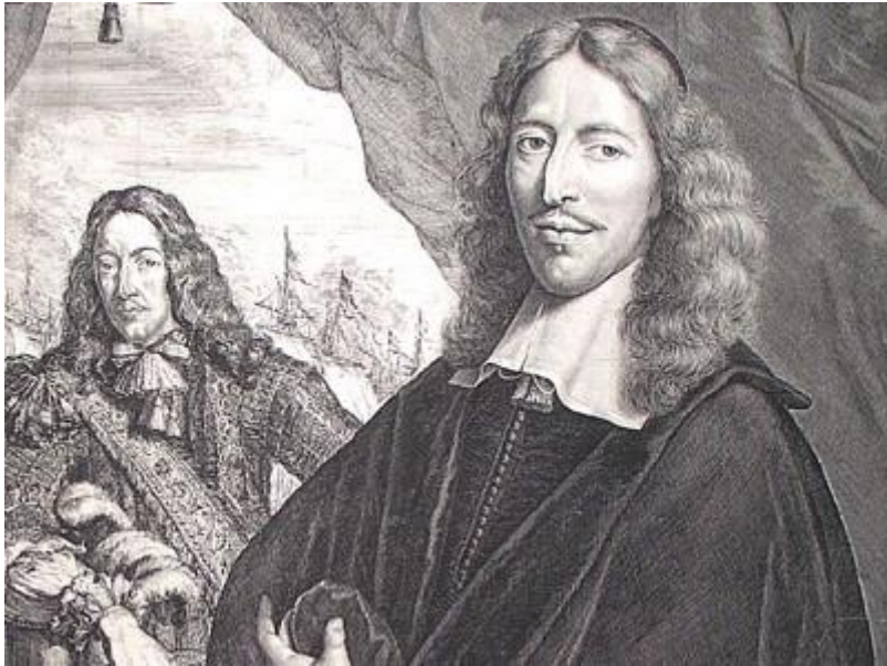
Johan (rechts) en Cornelis (links) de Witt

Johan de Witt werd in 1625 geboren in Dordrecht. Hij groeide op in een regenten (bestuurders) familie. Zijn vader was burgemeester van Dordrecht. Johan was een begaafd politicus en zorgde met de tocht naar Catham en een sterke vloot dat Engeland vernederd werd in de Tweede Engelse Oorlog. Door slim te beleggen wist hij de Republiek enorm rijk te maken. En zichzelf ook.